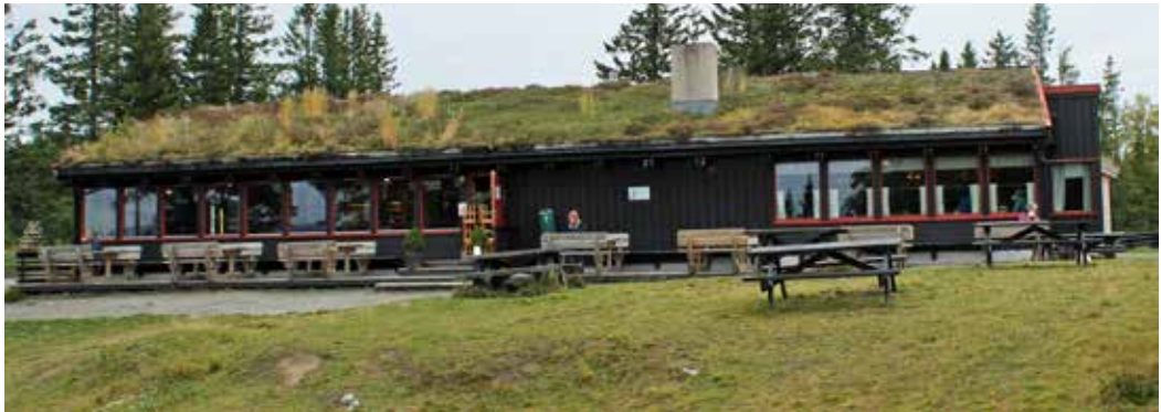
Estenstadhytta i 2020.