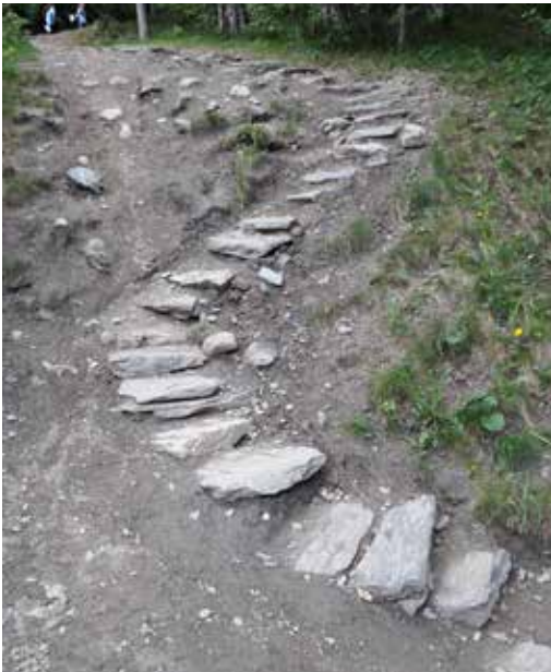
Steintrapp mellom Kvernhusflata og Tømmerholdtdammen.

Det er også etablert noen andre utsiktsplasser opp for Tømmerholdtdammen og på Stokkåsen. Disse kan det kanskje bli vanskelig å beholde som utsiktsplasser etter hvert som plantefeltene med gran gror til. På disse plassene er det også satt opp benker, og spesielt plassen ved Stokkåsen ser ut til å være populær.