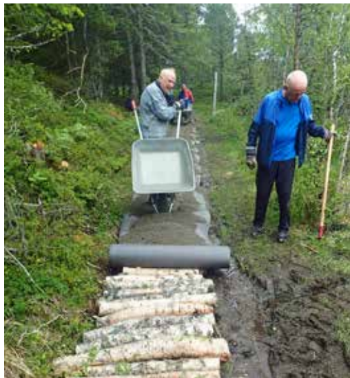
Ved kavling legger vi ut lag av stokker, fiberduk og grus. Fra Skogstien ved Kårstua.

Et friskt pust i dugnadene har vært bygging av trapper på spesielle steder. I alt er det bygget tre trapper, den største fra Kvernhusflata og opp til Tømmerholddammen. Denne ble mulig å bygge ved at kommunen bidro