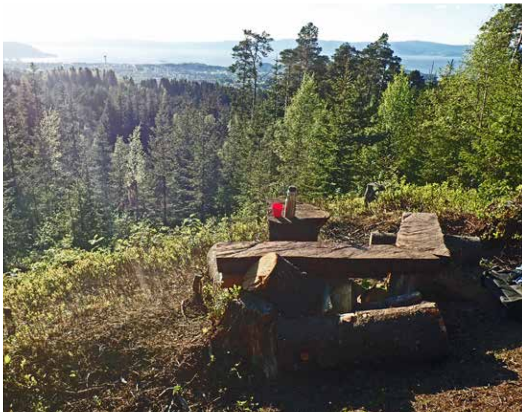
Fra Stokkåsen. God utsikt og med mulighet for å sette seg ned, er en viktig del av en god tur.

Benker er også satt opp ved den gamle husmannsplassen ved Stokkleiva. Her er det hugget ned mye yngre skog, og området blir slått hvert år i håp om å få fram tidligere kulturmark.