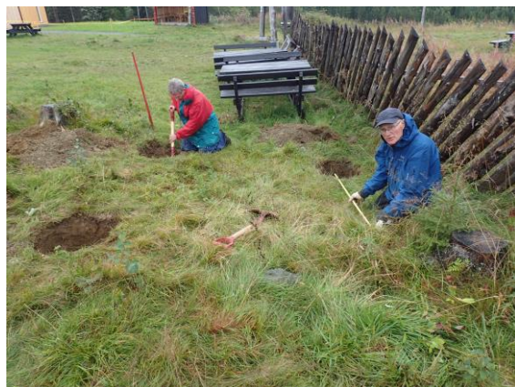
Graving for fundamenter for gapahuken