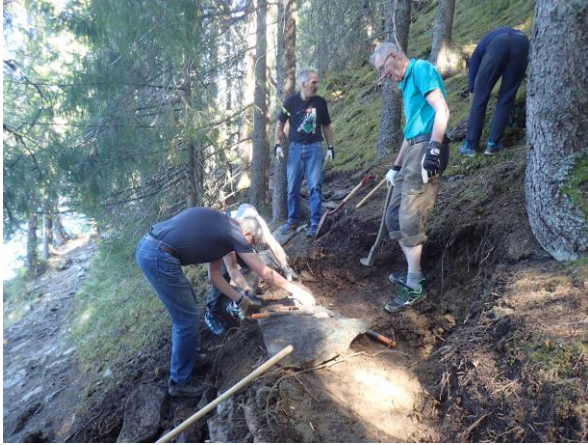
Utbedring av Fiskerstien