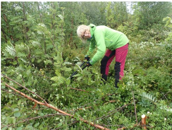
Rydding av kratt ved vegen opp til Hytta

Dessuten ble det arrangert en dugnad for å skaffe ved til hytta