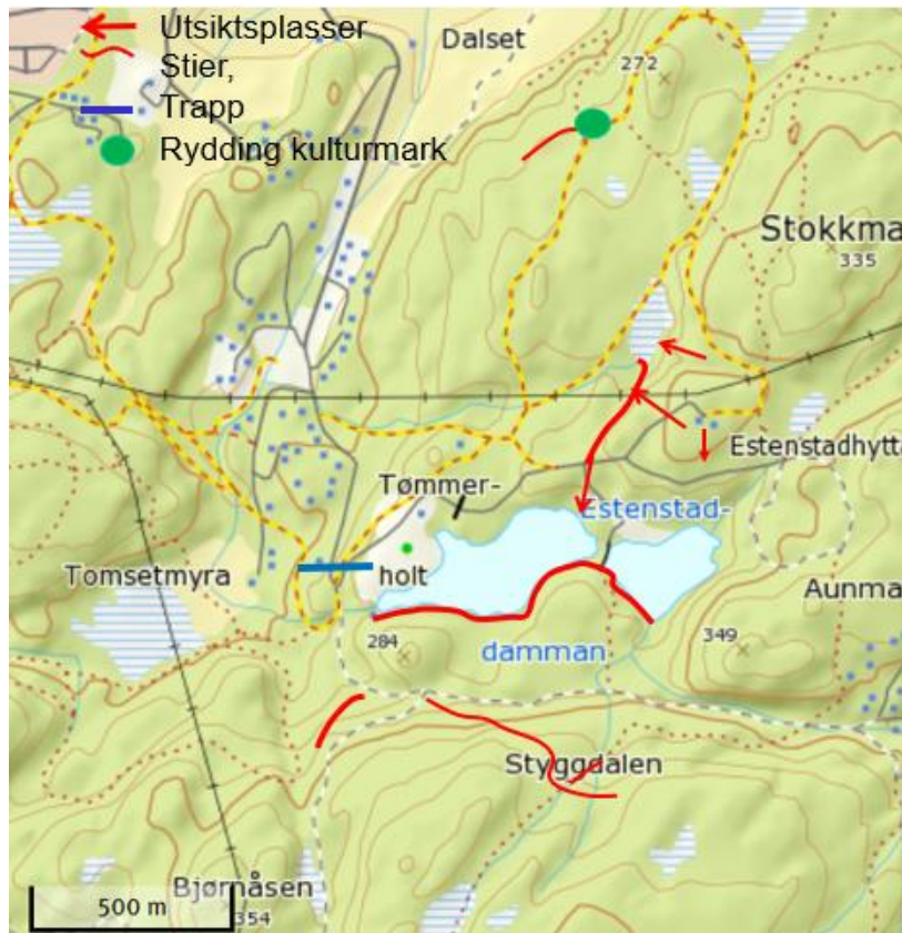
Kart med inntegning av steder for dugnadsaktivitet

En oversikt over hvor dugnadene er utført er vist på kartet: