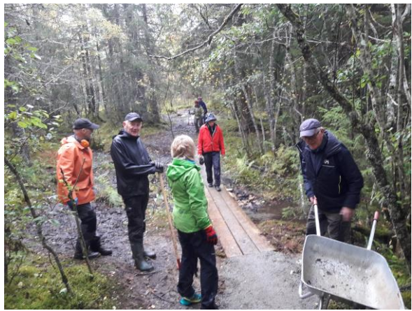
«Vandring» ved «Skilomløypa»