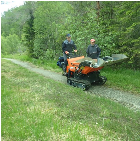
Utkjøring av grus. Lysløype-Veg til Hytta