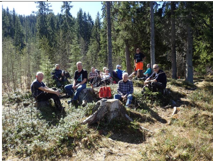
Pause ved Fiskerstien