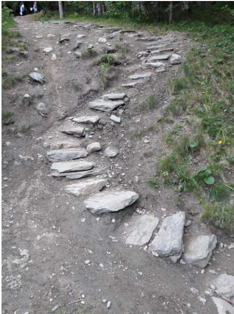
Øvre del av trappa

Etter anleggsarbeidet om vinteren var det tilgjengelig egnet stein for bygging av trapper. Disse ble brukt til å bygge en trapp og bro over bekken fra Kvernhusflata og opp til Tømmerholddammen.