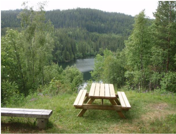
Utsikt ved Øvergjerdet