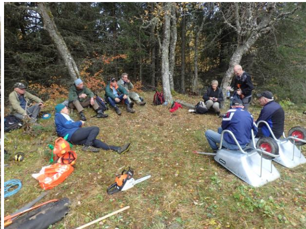
Rast ved Stokkplassen