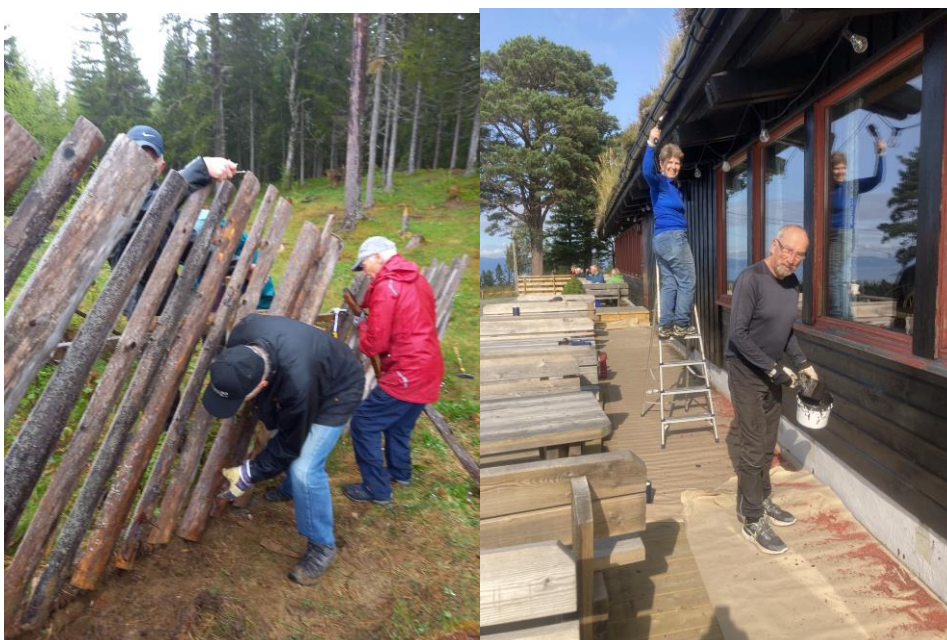
Dugnadsarbeid ved hytta

Nytt av året er oppsetting av flere «hoppestubber» for å skape aktivitet blant de unge, og muligens de voksne også.