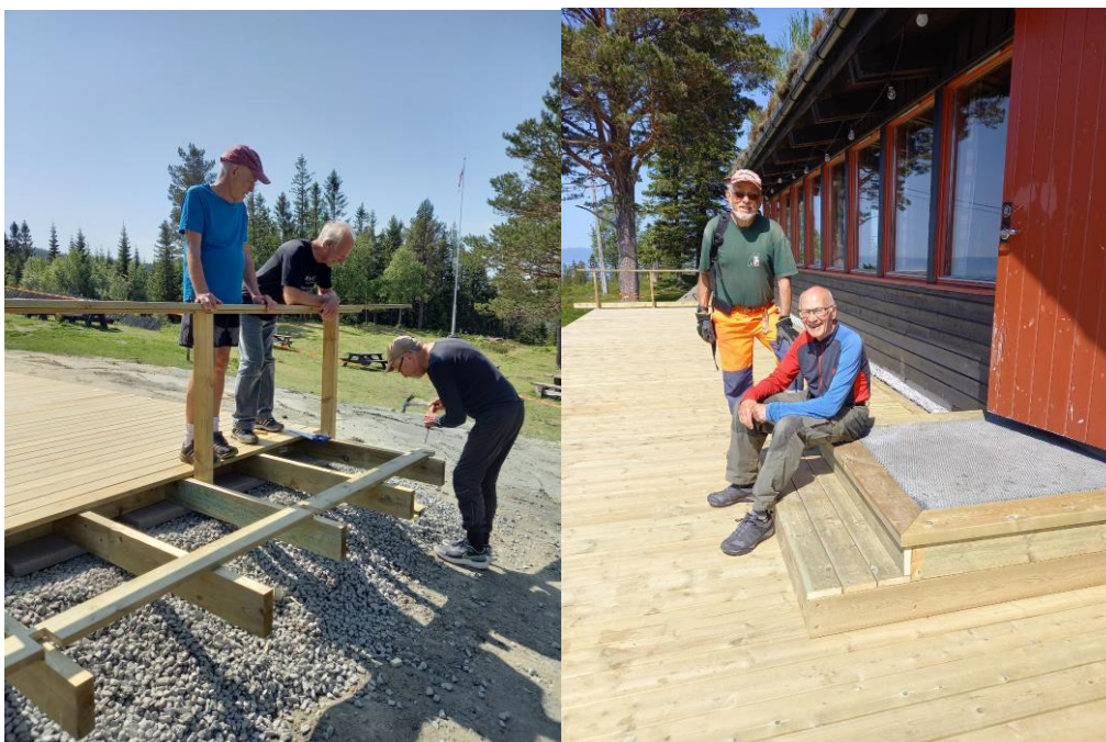
Fra arbeidet med bygging av platting på hytta