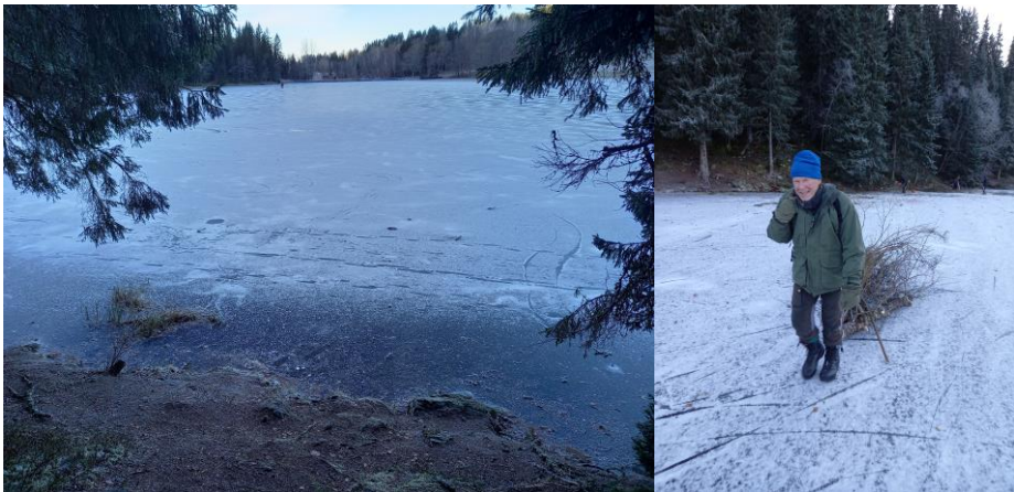
Etablering av «vinduer» ved Estenstaddammen

I november ble det arrangert to dugnader for å fjerne noe vegetasjon mellom stien innerst ved Estenstaddammen, fra odden og videre mot sør. Det gjorde det mulig å etablere tre vinduer mot vannet, slik at det blir mer lys på stien og en får god utsikt mot vannet og kveldssol. Trærne som ble felt ble dratt over isen i retning mot badeplassen.