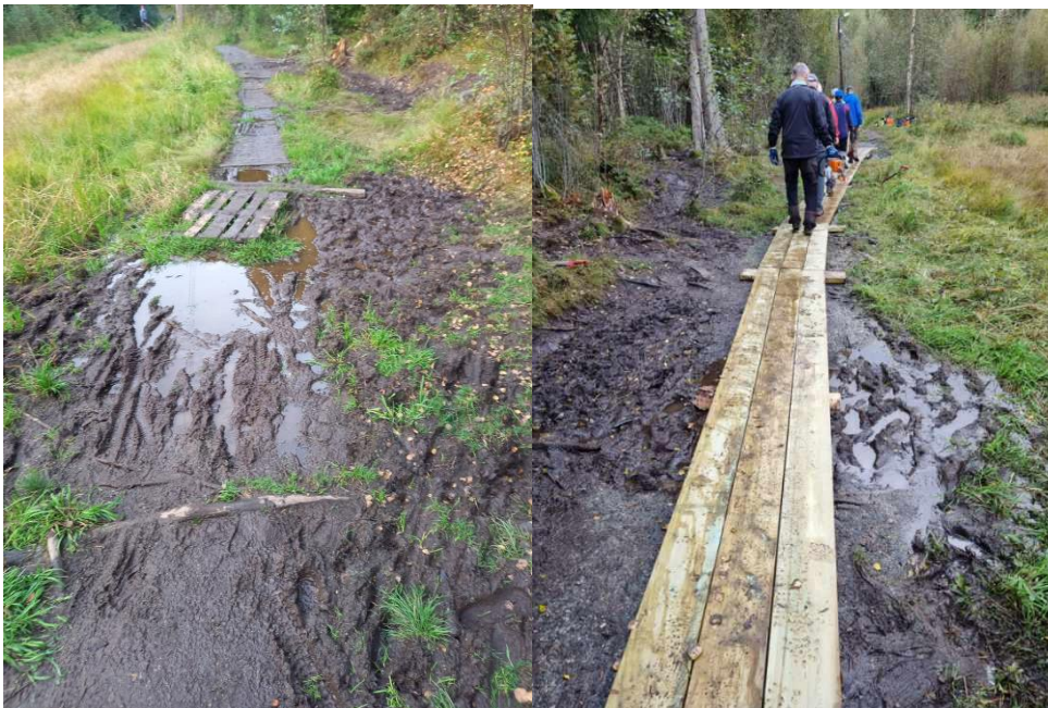
Utlegging av vandring øst for Fuglmyra, før og etter