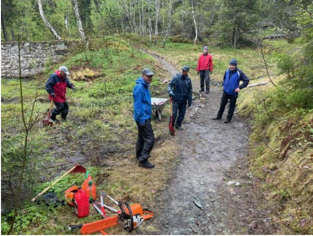
Kavling ved Reservedammen