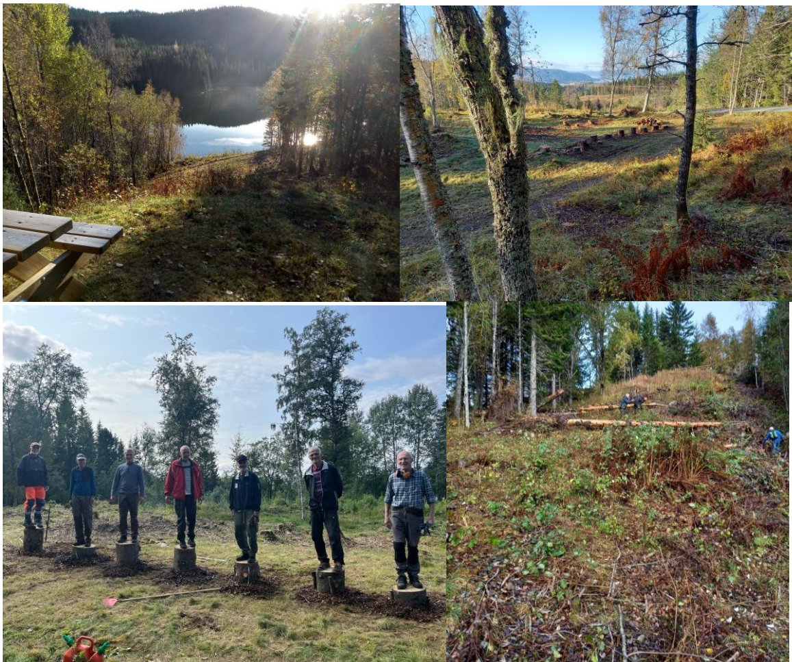
Fra Øvergjerdet. Utsikt mot Tømmerholdtdammen og mot byen. Stolte dugnadsfolk på «Hoppestubbene» og fra rydding i lia mot vannet.

Kommunen stilte i slutten av sesongen opp med fliskutter for å fjerne restene etter ryddearbeidet.