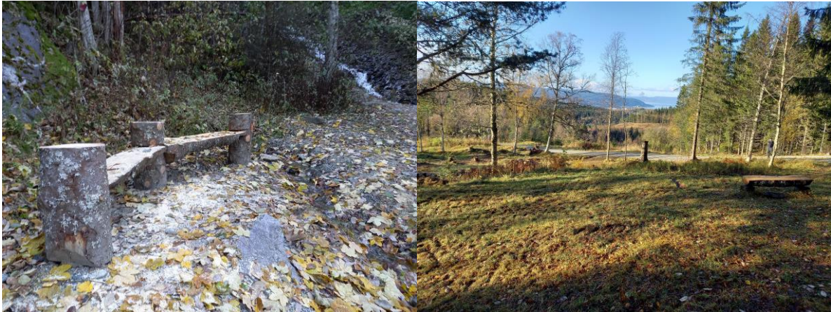
Benk ved Kvernhusflata, og benk ved Øvergjerdet med utsikt mot byen