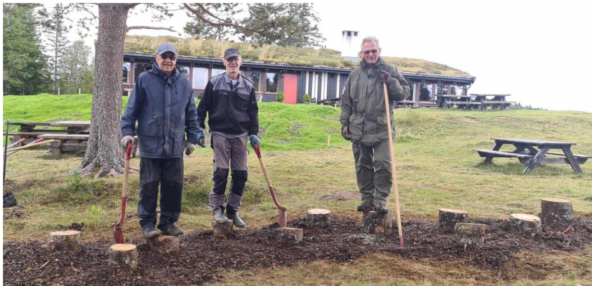
«Hoppestubber» ved Estenstadhytta