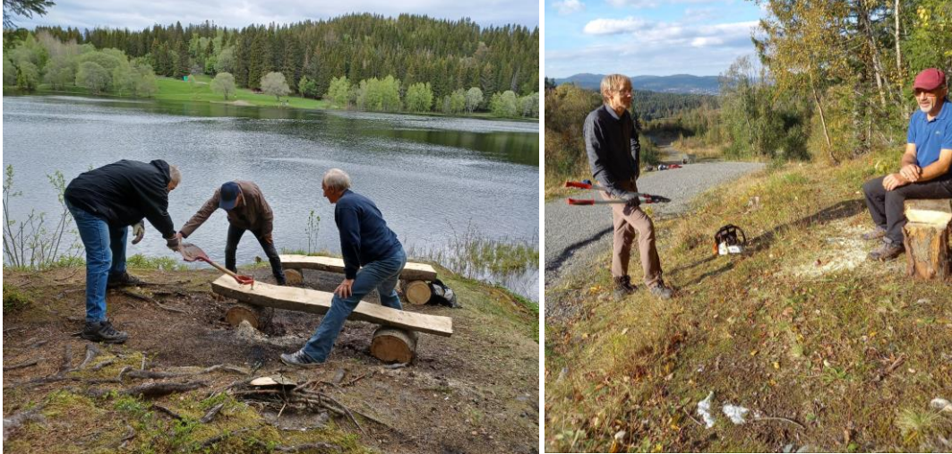
Benk ved Fiskerstien innerst ved Estenstadvannet, og nær Øvergjerdet med utsikt mot byen