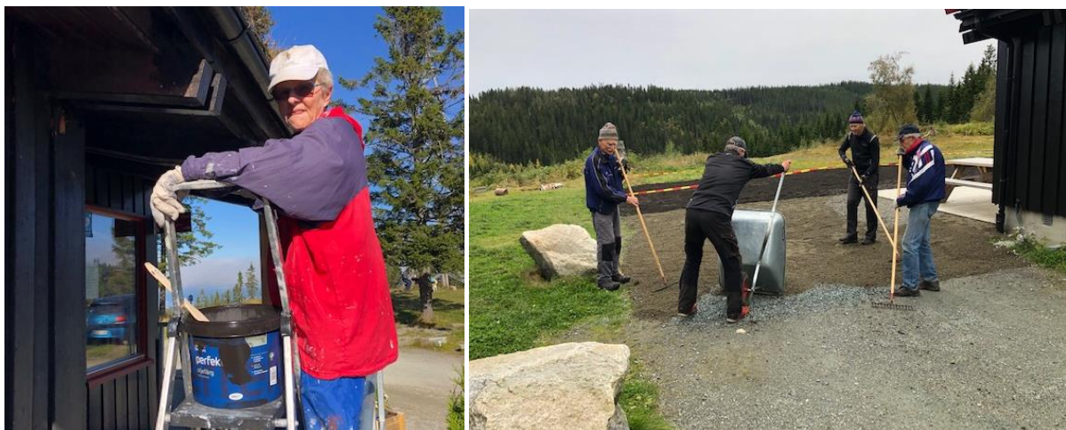
Dugnadsarbeid ved hytta

De første dugnadene ble det ryddet rundt hytta for å klarlegge for sommersesongen. Dessuten ble det fjernet trær og større vegetasjon for å beholde utsikten mot dammene, Månen og mot byen. Videre ble det kjørt ut jord og grus på enkelte partier og østveggen er malt.