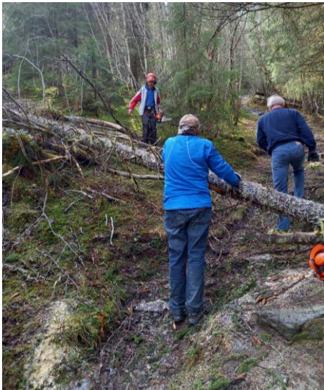
Fjerning av vindfall på sti mot Svarttjønn

Vinteren 21/22 var preget av enkelte kraftige stormer. Vi har i løpet av våren fjernet flere vindfall som har ligget over etablerte stier.