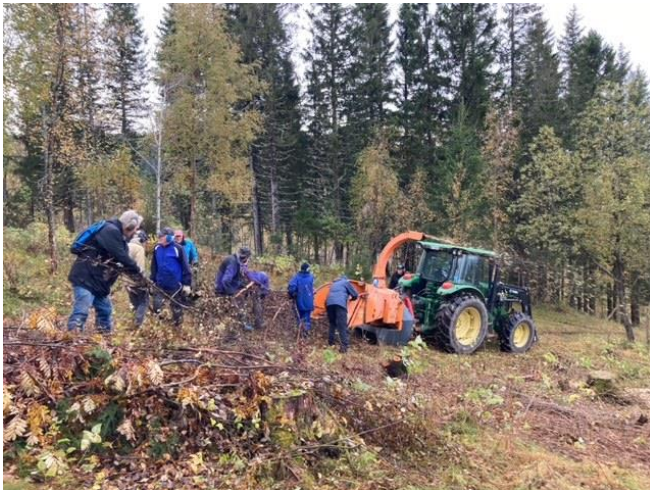
Flishogging for fjerning av nedfelt kratt ved Øvergjerdet