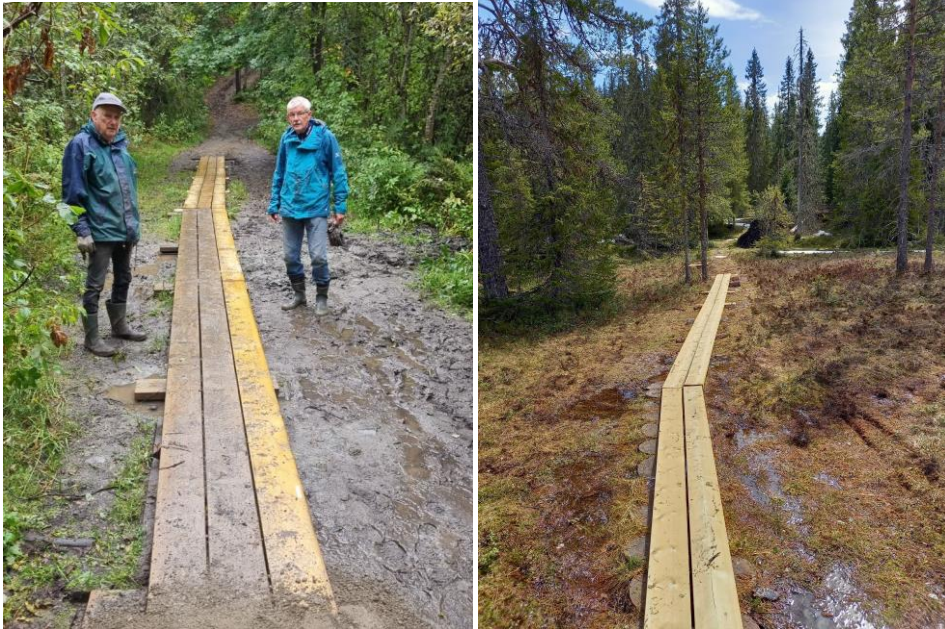
Utlegging av vandringer ved Kleivavegen og på myr mot Tomsetåsen