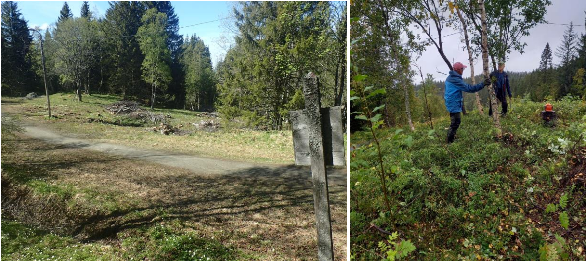
Fra den gamle husmannsplassen, Stokkplassen, og rydding av kratt ved Øvergjerdet

Arbeidet med å omforme området ved Øvergjerdet til gammel kulturmark har fortsatt. Det ble fjernet skog og kratt i området mellom Øvergjerdet og mot bilvegen, slik at det i dag er god utsikt mot byen.