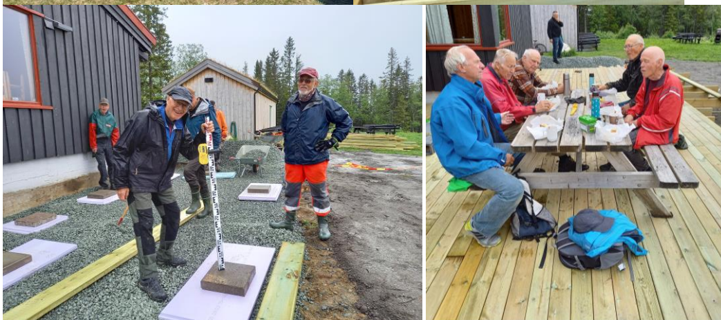
Fra arbeidet med bygging av platting på hytta