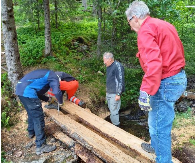
Utlegging av klopp ved Tømmerholtdammen