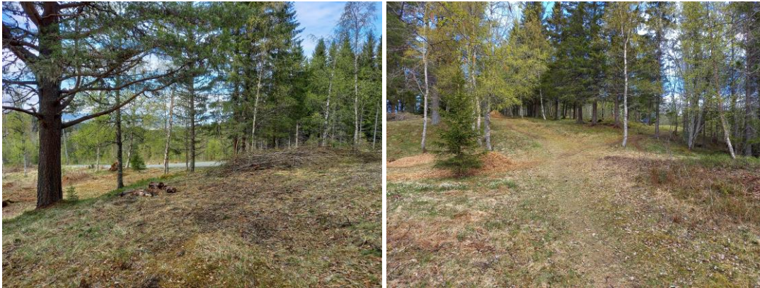
Fra ryddingen ved Øvergjerdet

Et av de siste småbrukene som ble lagt ned i Strindamarka var Øvergjerdet, som ble kjøpt opp av Strinda kommune i 1910 i forbindelse med bygging av vannverket. De siste årene er det lagt ned et omfattende ryddearbeid for å gjenskape den gamle kulturmarka, og få fram ruinene fra den gamle plassen. Dette arbeidet fortsatte i 2021, med fjerning av skog for å bedre utsikten mot byen og for å skape et åpent og trivelig område. Større vegetasjon ble fjernet fra hele området, og nytt og gammelt hogstavfall er fliset opp. Flisen ble benyttet til stien mellom Øvergjerdet og lysløypa.