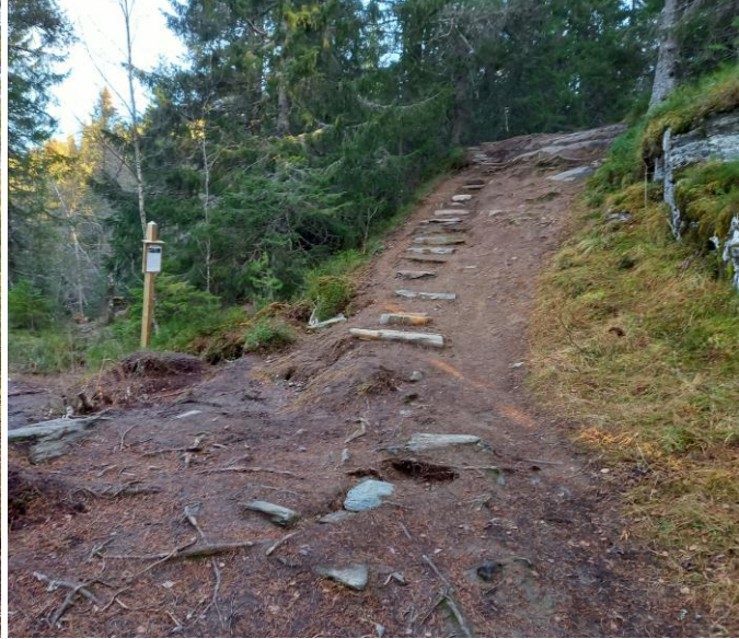
Trapp ved Burmaklippen