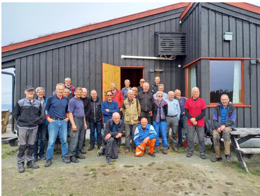
Årets dugnadsgjeng ved samling på Estenstadhytta