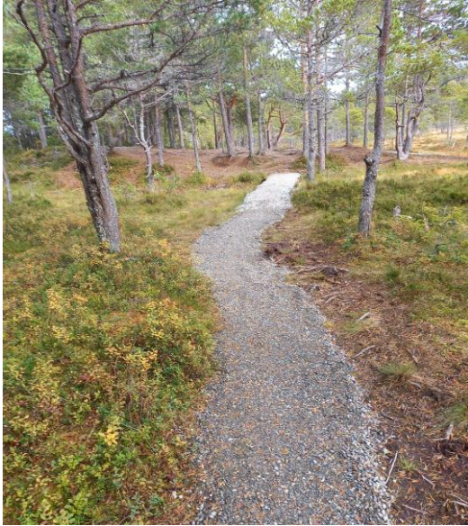
Kavlet og gruset sti ved Starrmyra