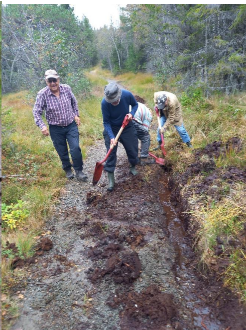
Utlegging av klopp på sti mot Burmaklippen. Grøfting og grusing av sti mellom Øvergjerdet og lysløypa