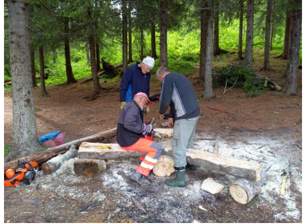
Benk ved Fiskerstien