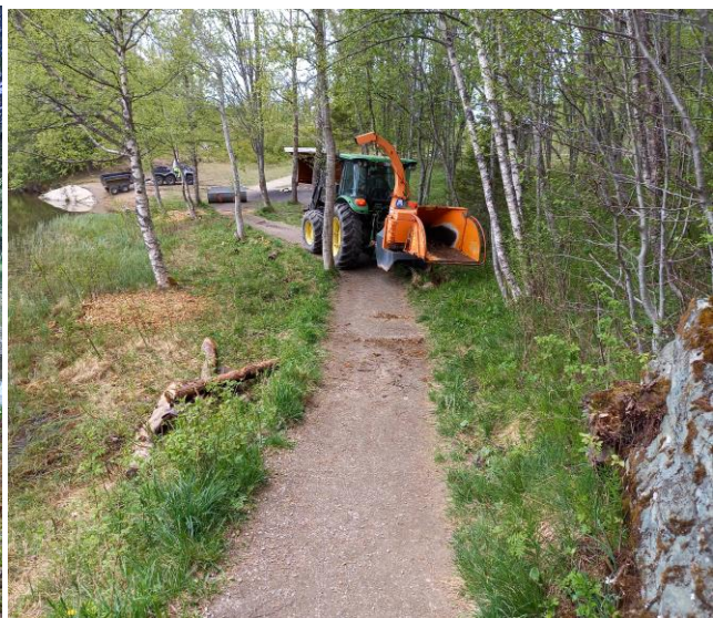
Oppsamlet rask fra rydding i strandsonen og oppflising av rask med flismaskin