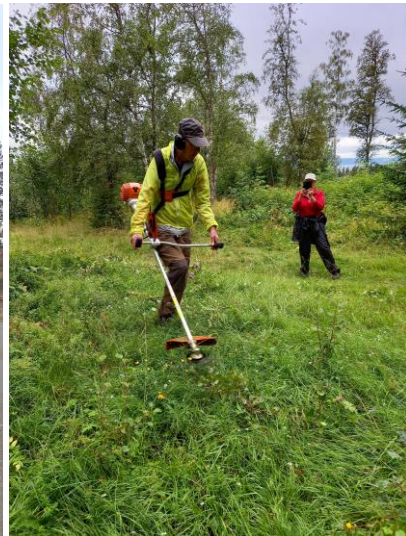
Utsikt mot byen fra lysløypa og rydding av området ved Øvergjerdet