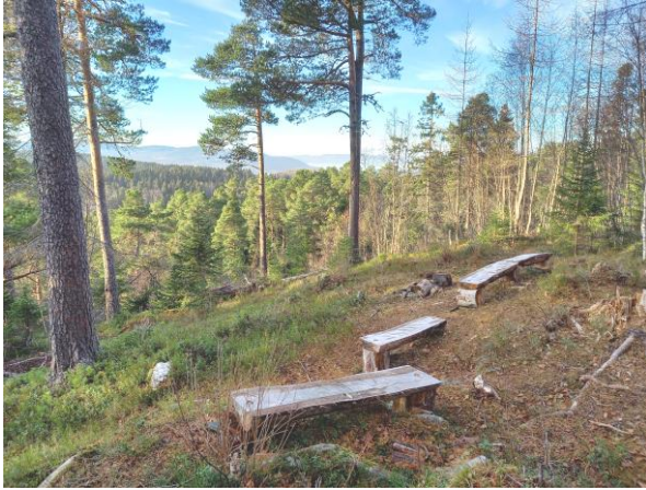
Benker og utsikt på haugen vest for sti mellom Akebakken og skogstien