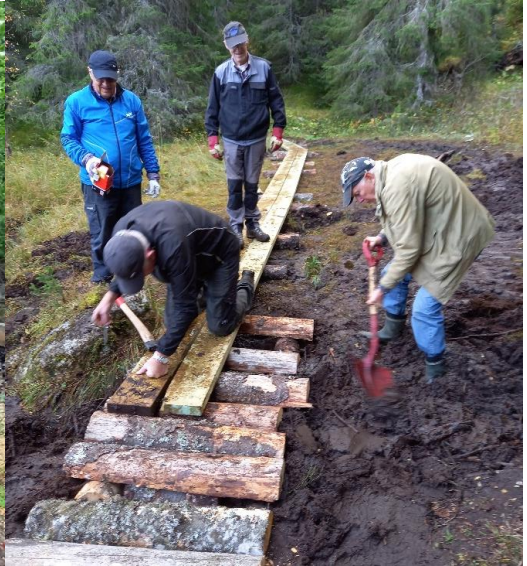
Utlegging av vandring og klopp opp mot Tomsetåsen